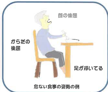
危ない食事の姿勢の例